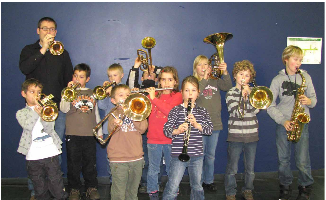
Der Musikvereins Vörsstetten gestaltet in vorbildlicher Weise eine Bläserklasse in Kooperation mit der Grundschule Vörsstetten.

Viele Jahre lang war in Baden-Württembergischen Grundschulen Musik als eigenständiges Fach abgeschafft und im Fächerverbund „Mensch-Natur-Kultur“ marginalisiert worden. Und wo Musik nicht unterrichtet wird, wachsen keine qualifizierten Fachkräfte nach. Das Ergebnis: Musik wird heute an den Grundschulen zu rund 80 Prozent fachfremd unterrichtet. Daran wird auch die Tatsache, dass Musik ab dem Schuljahr 2016/2017 wieder zum eigenständigen Unterrichtsfach wird, so schnell nichts ändern. Schließlich lässt sich ein Fachlehrermangel nicht durch einen po-