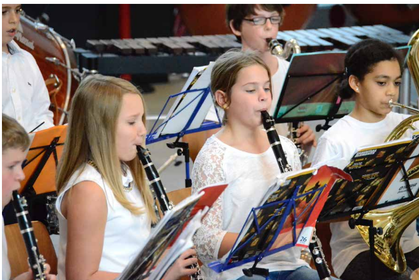
Bläserklassen sind in mehrerlei Hinsicht ein sinnvolles Modell für musikalische Bildung innerhalb des Musikvereins.

hoben, die mit einer Miet-Kauf-Option zum endgültigen Erwerb verbunden werden kann. Und dann sind da noch die Kommunen, die Bläserklassen ab und zu finanziell unter die Arme greifen. So in Hartheim, wo 2007 auf Initiative