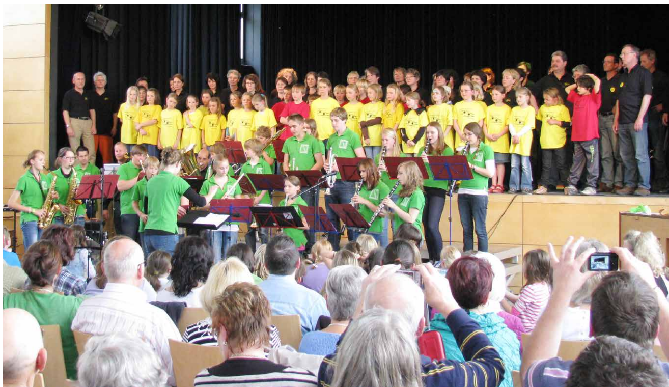
Innerhalb der Kooperationen werden oftmals auch Schulchor, Bläserklasse, Jugendorchester mit Unterstützung von Lehrkräften oder Eltern zusammengeführt. Ganz nach dem Motto: Musik verbindet.